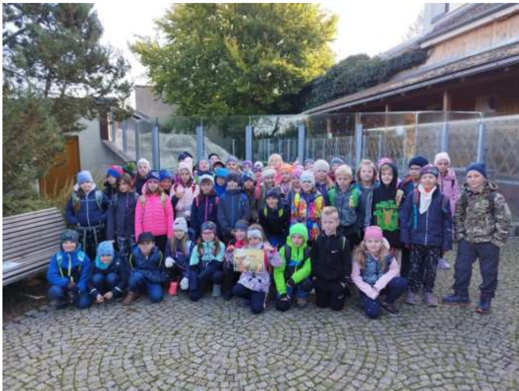
- Astronomický ústav AV ČR 6. A